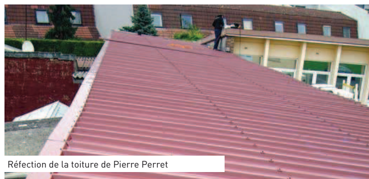
Réfection de la toiture de Pierre Perret