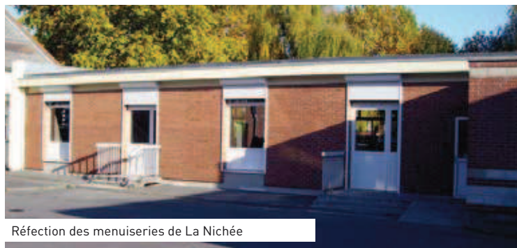
Réfection des menuiseries de La Nichée