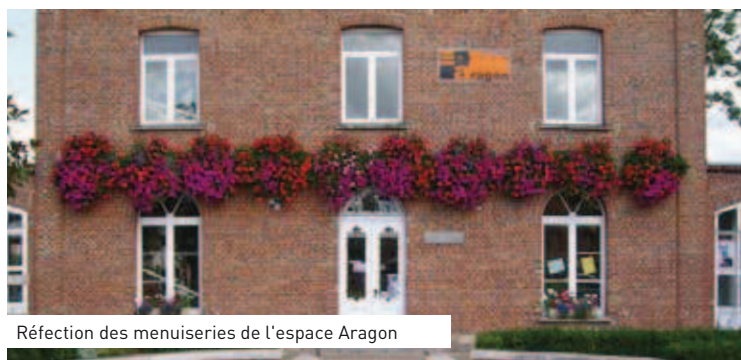
Réfection des menuiseries de l'espace Aragon