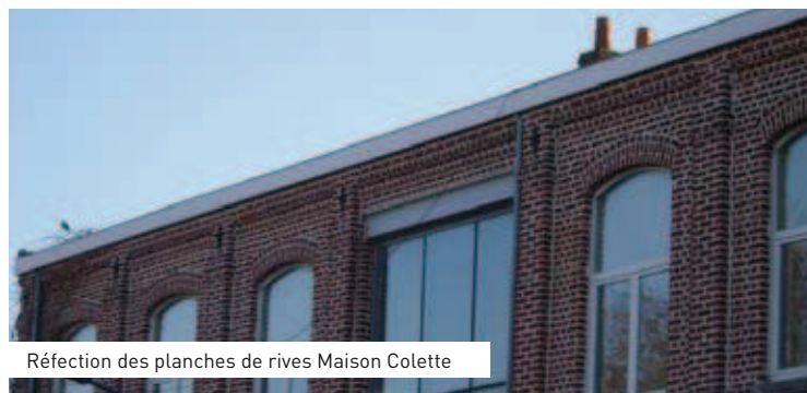
Réfection des planches de rives Maison Colette