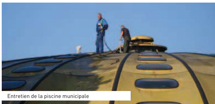
Entretien de la piscine municipale