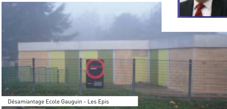
Désamiantage Ecole Gauguin - Les Epis