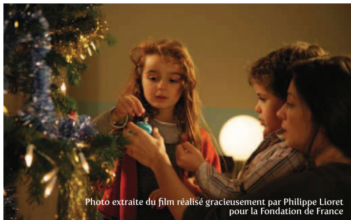
Photo extraite du film réalisé gracieusement par Philippe Lioret pour la Fondation de France