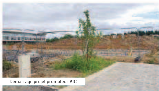
Démarrage projet promoteur KIC

Ce sera également l'occasion pour tous de constater l'avancement des travaux de création de voirie et d'aménagement réalisés par la Ville.