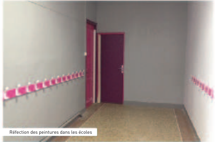
Réfection des peintures dans les écoles