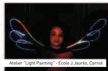
Atelier "Light Painting" - Ecole J.Jaurès, Carnot