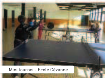
Mini tournoi - Ecole Cézanne