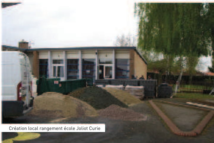
Création local rangement école Joliot Curie