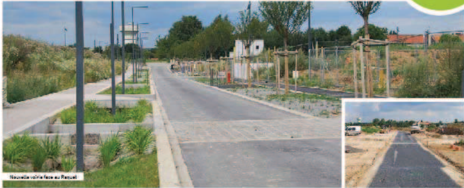
Nouvelle voirie face au Raquet.