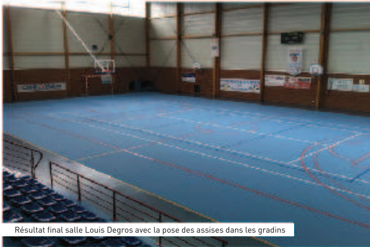
Résultat final salle Louis Degros avec la pose des assises dans les gradins