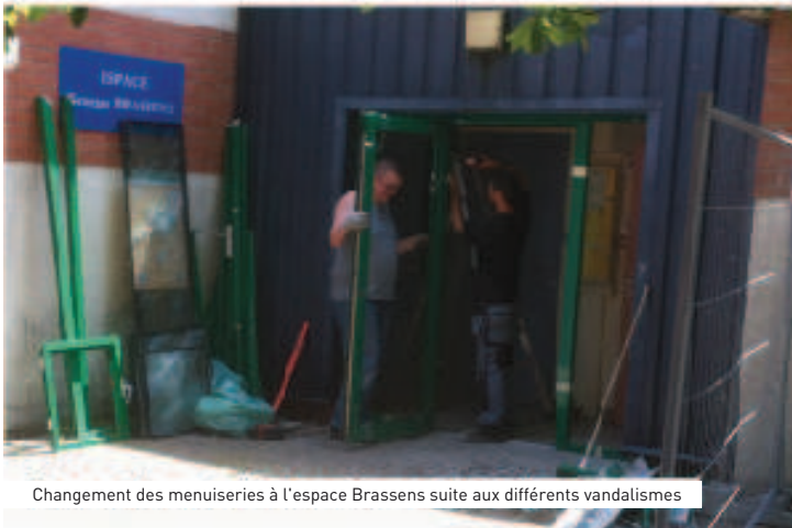
Changement des menuiseries à l'espace Brassens suite aux différents vandalismes