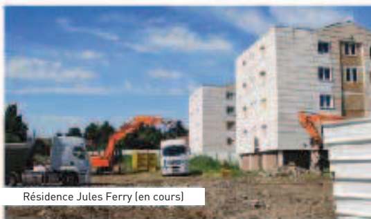
Résidence Jules Ferry (en cours)