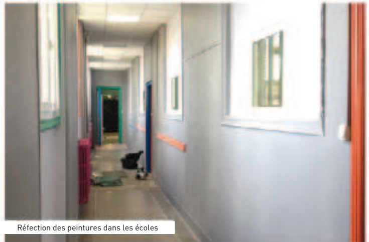
Réfection des peintures dans les écoles