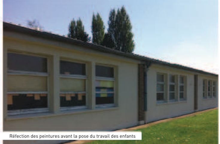
Réfection des peintures avant la pose du travail des enfants