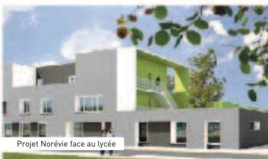
Projet Norvèie face au lycée