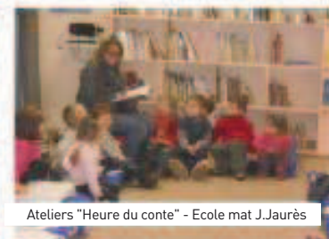
Ateliers "Heure du conte" - Ecole mat J.Jaurès