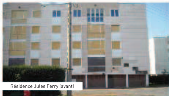
Résidence Jules Ferry (avant)