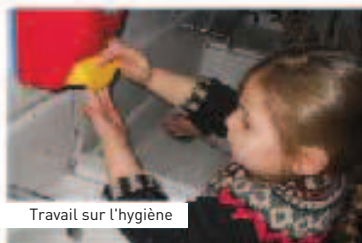
Travail sur l'hygiène

Dispositif financé par la ville, l'ACSé et la CAF.