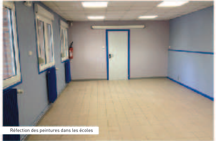
Réfection des peintures dans les écoles