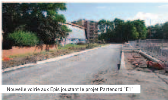
Nouvelle voirie aux Epis jouxtant le projet Partenord "E1"