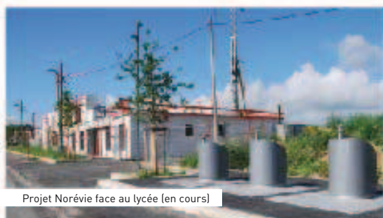
Projet Norvèie face au lycée (en cours)